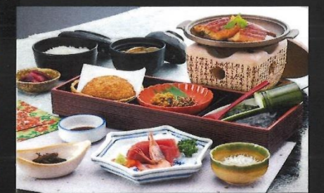
昼食～遠州やらまいか御膳～

10月1日(火) 7:45集合-8時出発 お一人様 6,500円(お申込み時に徴収します) 定員先着 28名(塩津地区在住・在勤の方にかぎる) 予約受付:8月6日(火)～9月3日(火)まで