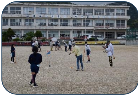
グラウンドゴルフ

今年度の「放課後子ども教室」(『塩津小学校地域学校協働活動本部』主催)が始まりました。5月16日(木)の1回目は塩津小学校運動場でグラウンドゴルフ【4年以上】。6月20日(木)の2回目は公民館で「お茶会」【4年以下】。どちらも多くの児童の参加があり、指導のためにお手伝いいただいた方達も子ども達との交流を存分に楽しんでいただきました。